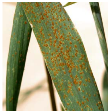
atac de rugina bruna