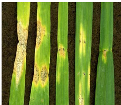
atac de septorioza

Cariopsele atacate au culoare cenusie-verzuie, sunt mai mici, mai umflate cu santul ventral mai putin pronuntat decat in cazul cariopselor sanatoase. De obicei, sunt atacate toate cariopsele dintr-un spic.