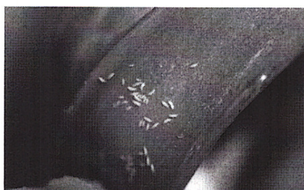
tripsul la ceapa

Condițiile climatice din ultimele zile au favorizat apariția și dezvoltarea daunătorilor: tripsul comun (Thrips spp.) și musca cepei (Hylemia antiqua).